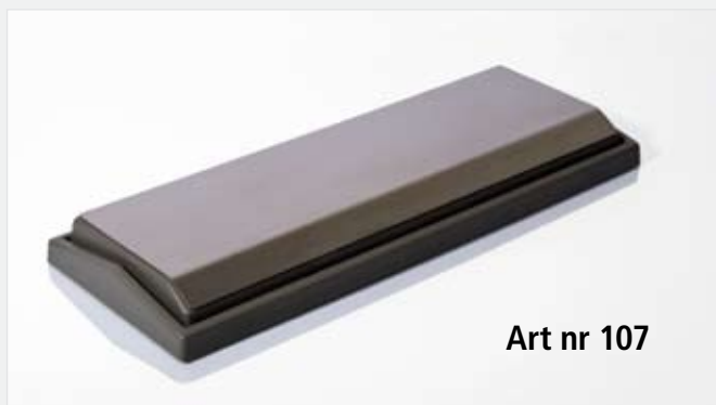
Art nr 107