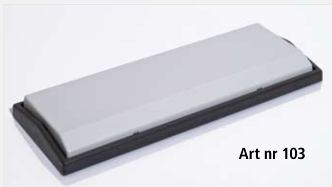
Art nr 103