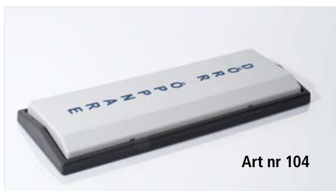
Art nr 104